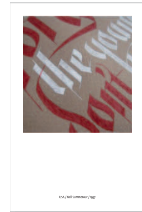
USA / Neil Summerour / 1997