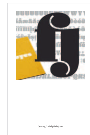
Germany / Ludwig Ubele / 2001