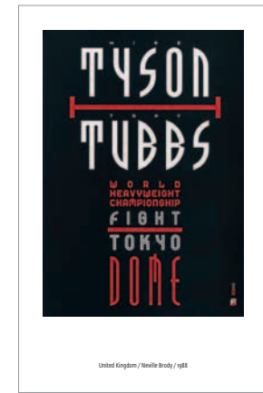
United Kingdom / Neville Brody / 1988