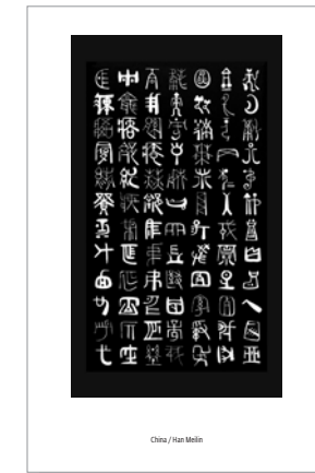
China / Han Meilin